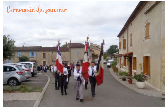
Cérémonie du souvenir

En décembre, la place de la Mairie s'est revêtue de ses décorations de fêtes pour célébrer la fin de l'année et le nouvel an à venir.