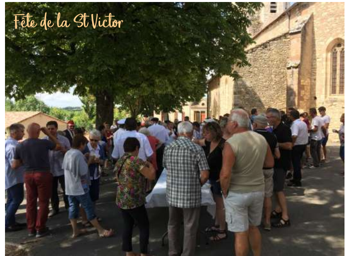
Fête de la St Victor