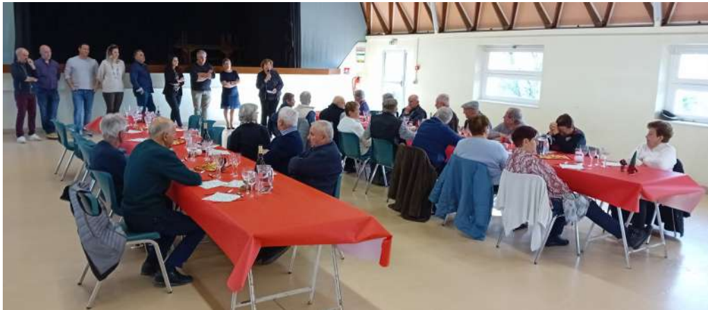
Les conseillers municipaux au service de nos aînés

Le repas des aînés de plus de 75 ans s'est tenu le 10 décembre. Un moment chaleureux où les convives se sont retrouvés avec plaisir autour d'un bon repas pour échanger et passer un bel après-midi.